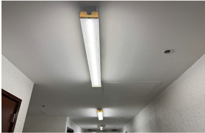
廉署大樓內裝設的LED燈