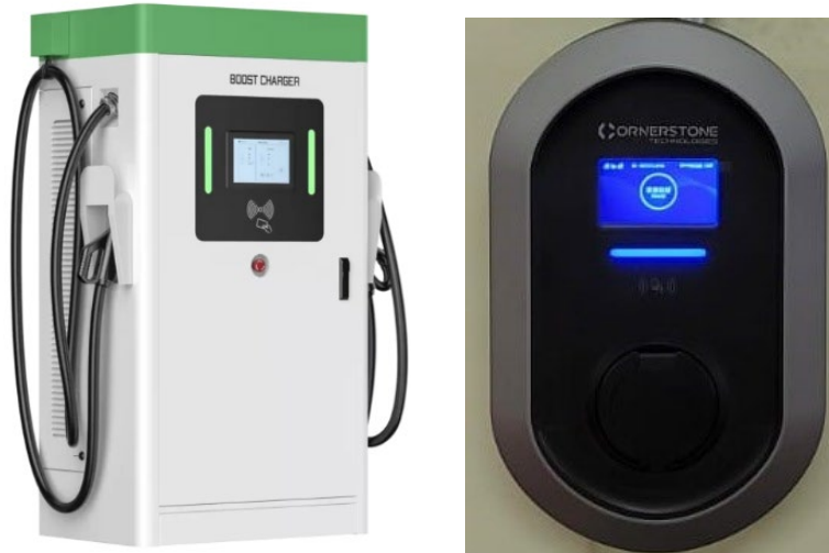
廉署大樓內安裝電動車充電器