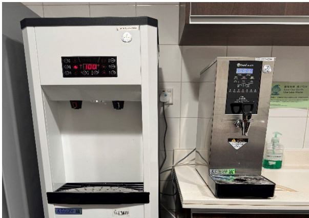
安裝於廉署辦事處茶水間的逆滲透濾水器和熱水機